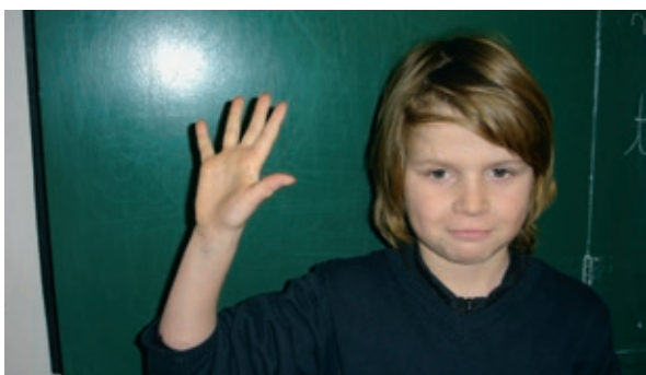
Au revoir : « Agiter la main »