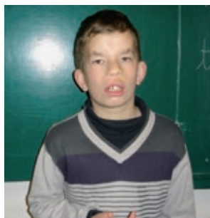
Merci : « Une fois et sourire »