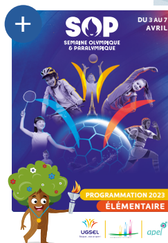
Exemple de guide pédagogique édition 2023